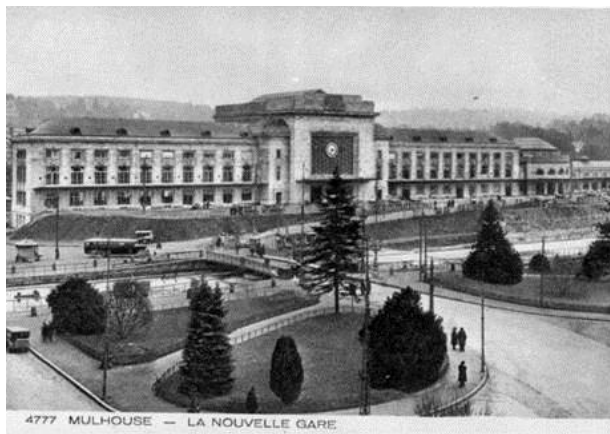
29 décembre 1932 : inauguration du bâtiment actuel de la gare de Mulhouse. Construit entre 1928 et 1932 par les architectes Schulé, Doll et Gélis.