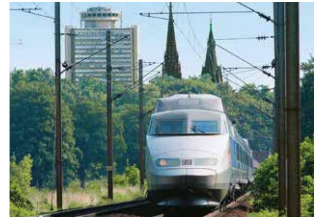
10 décembre 2011 : arrivée du TGV Rhin-Rhône en gare de Mulhouse, plaçant la ville dans un hub ferroviaire au cœur de l'Europe à grande vitesse, ce qui permet de relier Mulhouse à Paris et Lyon en 2h40.