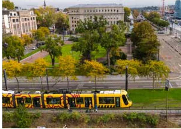
22 février 2021 : démarrage des travaux de dévoilement du canal et de réaménagement du square du Général de Gaulle