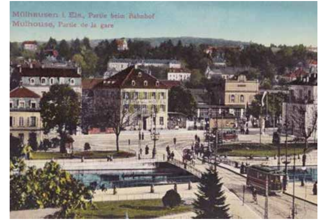
1882 : inauguration du premier réseau tramway à Mulhouse. Ce réseau a cessé de fonctionner en 1957 du fait de l'essor de l'automobile