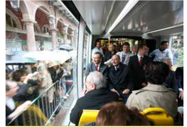
20 mai 2006 : inauguration de deux lignes du tram par le président de la République Jacques Chirac