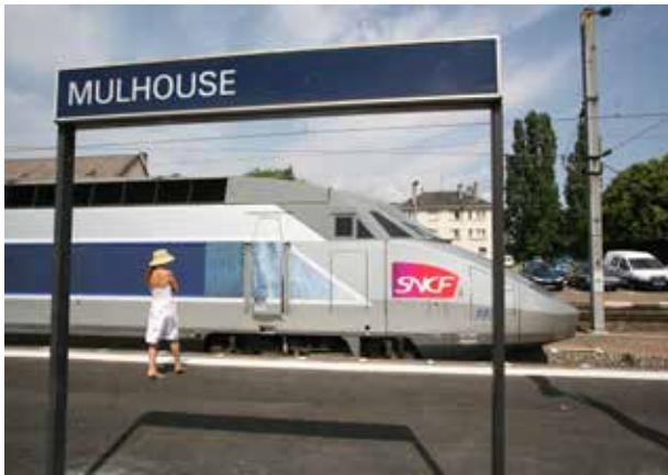
10 juin 2007 : mise en service de la ligne à grande vitesse (LGV) Est Européen reliant Mulhouse à la gare Paris-Est