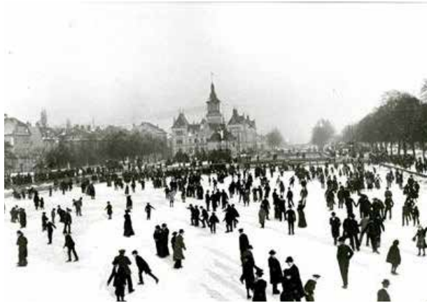
Images du bassin de déchargement. Lorsqu'il n'avait plus de vocation industrielle, il servait pour les loisirs : cabotage aux beaux jours, patinage en hiver...