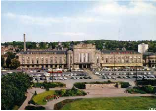
19 novembre 1959 : inauguration du monument de la 1 er DB par le Général de Gaulle

1970 : la promenade et une partie de la rue du 17 novembre sont renommées : place du Général de Gaulle