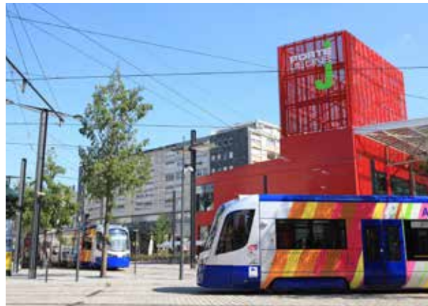
11 et 12 décembre 2010 : mise en service de la ligne tram-train reliant Mulhouse à la vallée de la Thur et de la ligne 3 de tram Mulhouse - Lutterbach