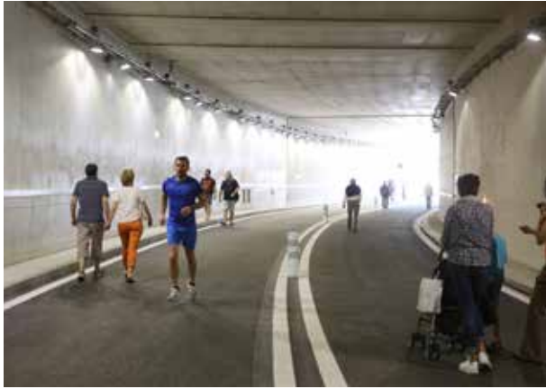
21 avril 2018 : inauguration du tunnel de la gare point final des travaux de la voie sud Mulhousienne