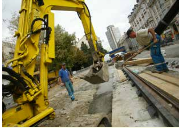
2003 : lancement des travaux d'installation des nouvelles lignes de tramway

1970 : la promenade et une partie de la rue du 17 novembre sont renommées : place du Général de Gaulle